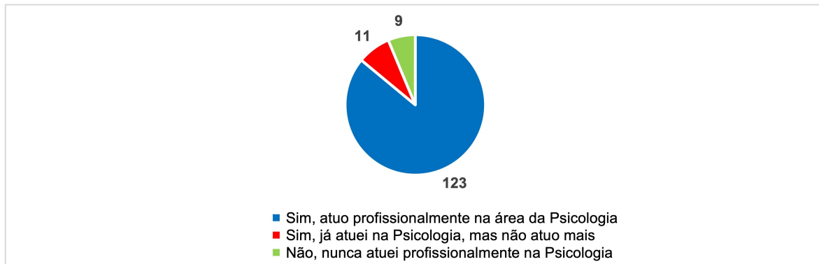
Gráfico 1. Atuação em Psicologia desde a conclusão do curso.

No Gráfico 1, observa-se que dos 143 egressos, apenas 20 não tem a Psicologia como atuação profissional até o momento da pesquisa, sendo que destes 9 nunca atuaram profissionalmente na área após a formação. Também fora questionado: Em caso afirmativo para a questão anterior, assinale qual/quaís áreas da Psicologia você atuou/atua.